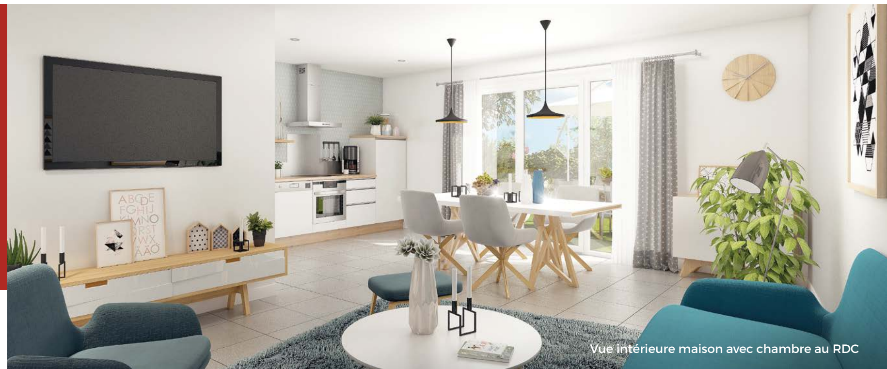
Vue intérieure maison avec chambre au RDC