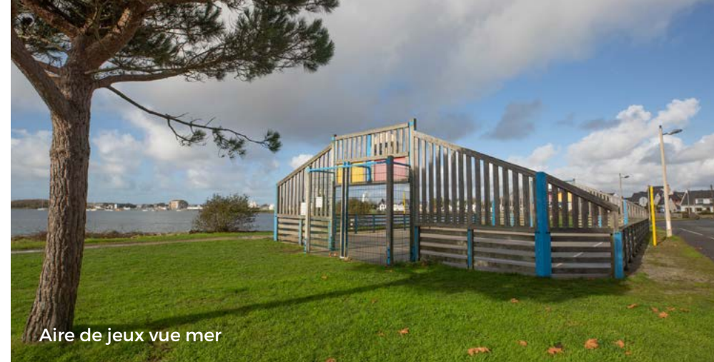
Aire de jeux vue mer